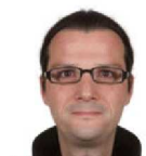
SYMMETRIE LINKS = RECHTS